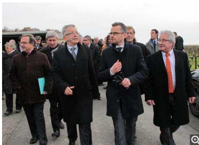
Une foule d'officiels s'est massée, hier, au lycée viticole d'Amboise, où sera implanté le Vinopôle, en gestation depuis 2009.